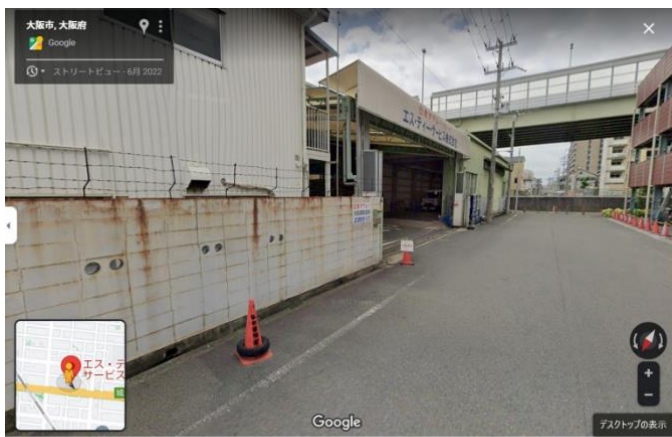
※センター入口上部写真